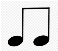
FIGURA CORCHEA DOS GOLPES SOLITOS